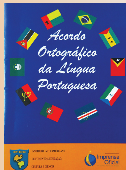
A cartilha que entra no kit para os estudantes

O Instituto Interamericano de Fomento à Educação, Cultura e Ciência (Ifec), um dos parceiros da Câmara de Vereadores no Programa Escola de Democracia, anuncia uma novidade no ano em que comemora 10 anos de fundação. A partir de agora, além das quatro cartilhas de cidadania que são distribuídas às crianças que visitam o Legislativo, será entregue material sobre o novo acordo ortográfico da língua portuguesa. Página 15