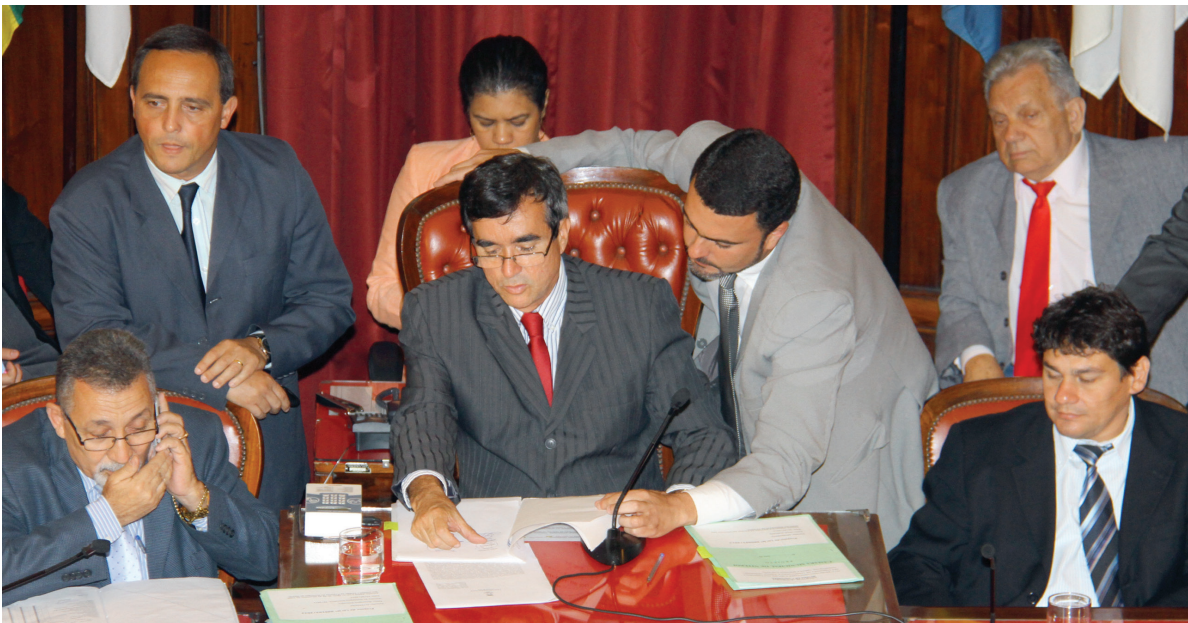
Todos os 16 vereadores presentes à sessão votaram pela Lei da Ficha Limpa no serviço público municipal do Executivo e do Legislativo, votando a emenda 01/2012, que alterou a Lei Orgânica

poderes Executivo e Legislativo, de quem seja inelegível em razão de condenação decorrente de ato ilícito nos termos da legislação federal, Lei Complementar 135 de 2010”.