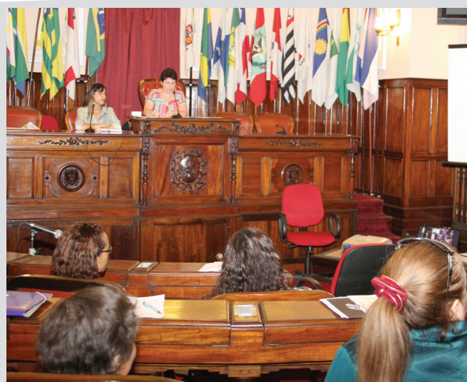
As mulheres ocuparam o plenário da Câmara para acompanhar os debates

Outro mecanismo em defesa das mulheres é o Fórum Nacional de Instâncias de Mulheres de Partidos Políticos atuando de forma multipartidária, representado por 16 partidos políticos. Entre as propostas do Fórum está a construção de escolas em áreas rurais,