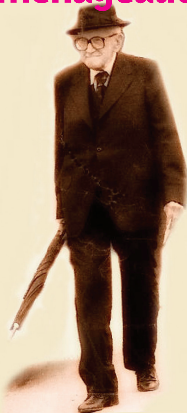
Jurista Sobral Pinto