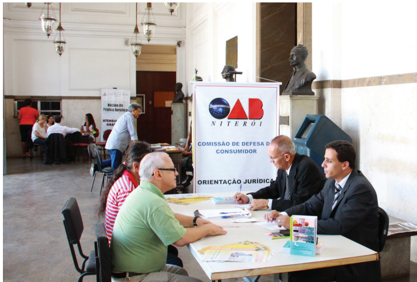
Advogados da OAB Niterói e da Codecon prestam orientação jurídica a consumidores na Câmara

O Dia Mundial dos Direitos do Consumidor, comemorado em 15 de março, foi lembrado em evento na Câmara de Vereadores. Parceria entre a Comissão de Defesa do Consumidor da Ordem dos Advogados do Brasil (OAB) de Niterói; Coordenadoria de Defesa do Consumidor (Codecon) da Câmara; e a Universidade Candido Mendes, teve um dia inteiro de prestação de atendimento jurídico gratuito à população e dicas ao consumidor.