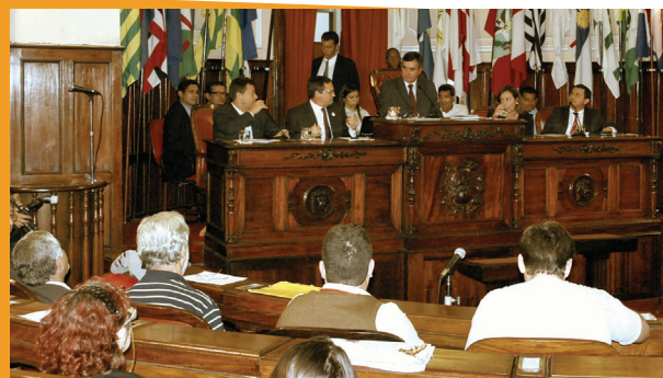
Audiências realizadas em 2011 contaram com grande participação popular